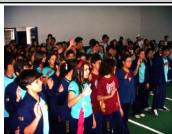
Abertura Oficial da Gincana